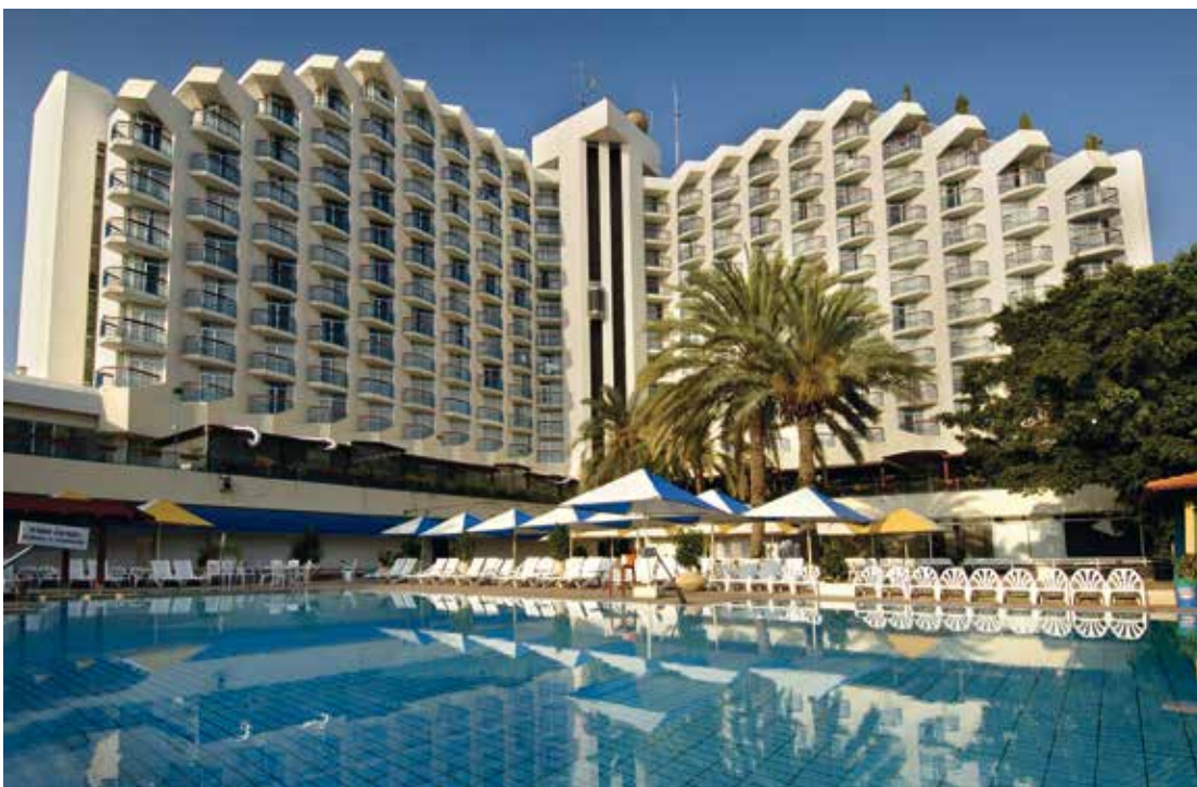
Leonardo Club - Tiberias

Osoite: 16 Ussishkin, Tiberias Ylä-Tiberiaan rinteessä, rauhallisessa vehreässä kaupunkiympäristössä sijaitseva hyvä keskitason hotelli, uudistettu vuonna 2019. Keskustasta hotelliin on matkaa n. 1,5 km, josta suurin osa ylämäkeä. Hotellissa on ruokasali (kosher), baari, uima-allas (huhti-lokakuussa, ei käytössä uskonnollisina juhlapäivinä), 86 huonetta, joissa wc / kylpyhuone, tv, puhelin, jääkaappi, lämmitys / ilmastointi.